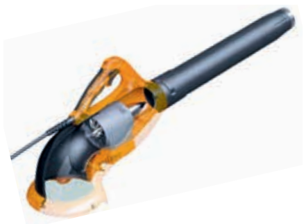
Airion puhaltimen runko on kestävää magnesiumvalua