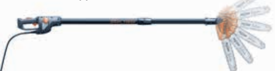
Selion Teleskooppimalli T150/200