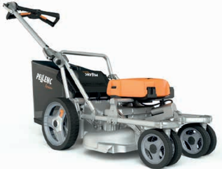
Rasion Smart keräävä akkuruohonleikkuri

Pellenc Rasion Smart perässäkäveltävä akkukäyttöinen ruohonleikkuri on tarkoitettu ammattilaisille ja vaativaan kotikäyttöön. Ainutlaatuisen kevyt, värinätön ja äänetön leikkuri sisältää uusia ominaisuuksia: leikkulaitteen 2-terärakenne varmistaa nopean ja tehokkaan leikkuun. Iso 70L kerääjä on tukkeutumaton. Leikkuuleveys on 60cm. Laitteen voi nostaa huoletta pystyyn huoltoasentoon. Terien pyörimisnopeutta voi säätää 3000 - 5000 rpm välillä. Sähkökäyttöinen leikkuukorkeuden kaukosäätö, säädettävä ajonopeus, peruutus sekä leikkurin ajosuunnan ohjaus. Moottori on öljyttömänä täysin tunteeton maaston vaihtelulle ja laite kestää kaltevalla pinnalla ajoa vuosikausia toisin kuin 4-tahtimoottorilla varustetut bensiinileikkurit. Ei polttoainekuluja, ei päästöjä eikä melua. Työteho yhdellä 1100 akun latauksella 3600m 2 .