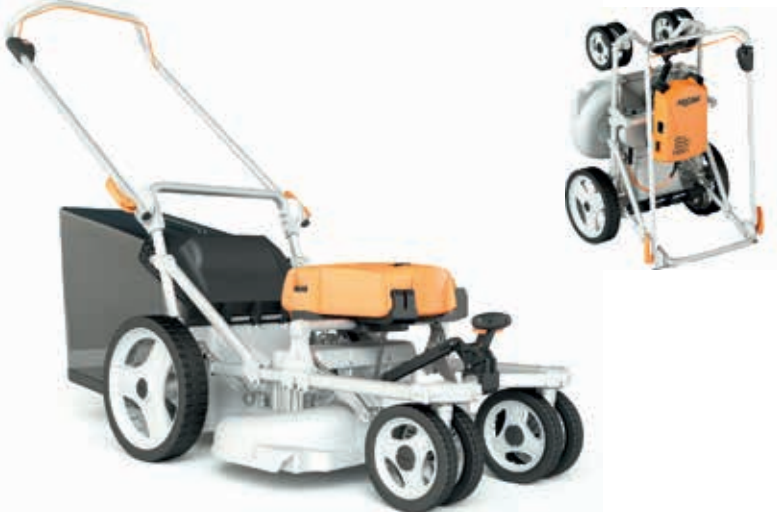
Rasion Basic keräävä akkuruohonleikkuri

Pellenc Rasion Basic perässäkäveltävä akkukäyttöinen ruohonleikkuri on tarkoitettu ammattilaisille ja vaativaan kotikäyttöön. Ainutlaatuisen kevyt, värinätön ja äänetön leikkuri sisältää uusia ominaisuuksia: leikkuulaitteen 2-terärakenne varmistaa nopean ja tehokkaan leikkuun. Iso 70L kerääjä on tukkeutumaton. Leikkuuleveys on 60cm. Laitteen voi nostaa huoletta pystyyn huoltoasentoon. Terien pyörimisnopeutta voi säätää 3000 - 5000 rpm välillä. Moottori on öljyttömänä täysin tunteeton maaston vaihtelulle ja laite kestää kaltevalla pinnalla ajoa vuosikausia toisin kuin 4-tahtimoottorilla varustetut bensiinileikkurit. Ei polttoainekuluja, ei päästöjä eikä melua. Työteho yhdellä 1100 akun latauksella 3600m 2 .