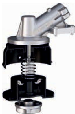
Excelion 1200 ja 2000 on saatavana monta siimapäätä