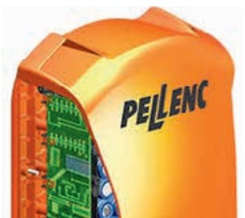
Tehokkaasti jäähdytetty ja tärinäsuojattu akkukennosto