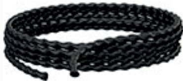
Pellenc kierretty siima parantaa huomattavasti suorituskykyä ja vähentää energiankulutusta ja melua