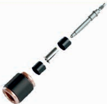
Kaikissa Pellenc työkaluissa on patentoitu huipputehokas hiiliharjaton suoravetomoottori