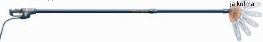
Selion Teleskooppimalli T220/300