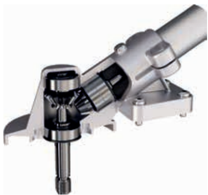
Excelion 2000 järea kulmavaihde