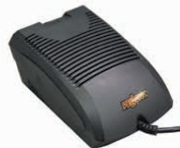
Akkupaketin mukana toimitettava vakiolaturi joko 1.2A tai 2.2A